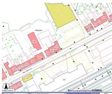
La consultation du PICC sur le Portail cartographique wallon

La présentation du logiciel SIG gratuit ArcExplorer a d'autre part démontré la possibilité d'utiliser simplement un SIG en peu de temps (pour le télécharger, aller sur http://www.esri.be ). D'autres solutions existent évidemment et sont disponibles à partir d'une simple recherche sur Internet.