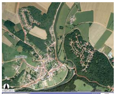
La consultation d'un PPNC sur le Portail cartographique wallon