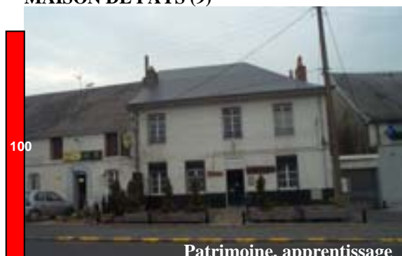
MAISON DE PAYS (9)