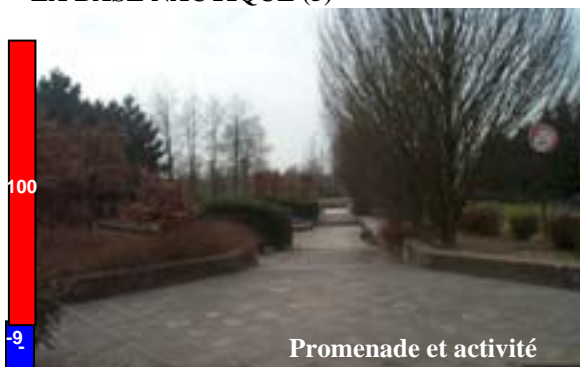
LA BASE NAUTIQUE (5)