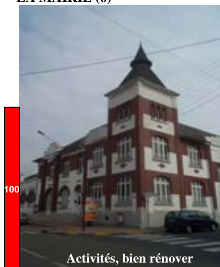
LA MAIRIE (6)