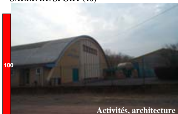
SALLE DE SPORT (10)