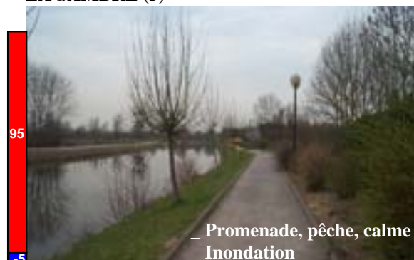
LA SAMBRE (3)