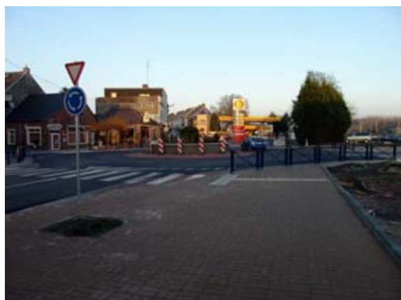
Rond-point nord-est marquant l'entrée dans la zone