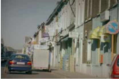
Commerces rue Albert 1 er