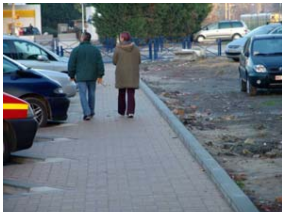
Aménagement des trottoirs et stationnement en épis, le long de la voirie, vers le rond-point au nord-est de la zone