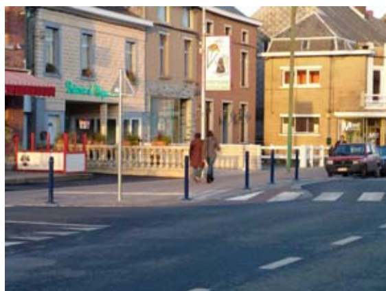
Élargissement des trottoirs au carrefour et placement de potelets anti-stationnement.