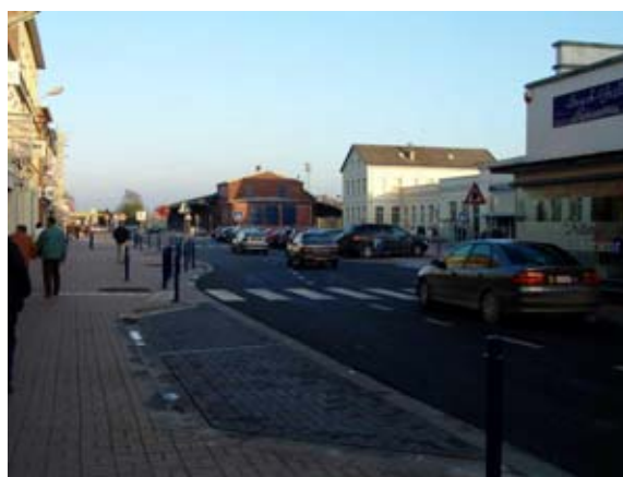
Élargissement des trottoirs du côté commerces. Changement de revêtement pour les parkings en voirie. Aménagement de chicanes en entrée et sortie de la place de la Gare pour ralentir le trafic.