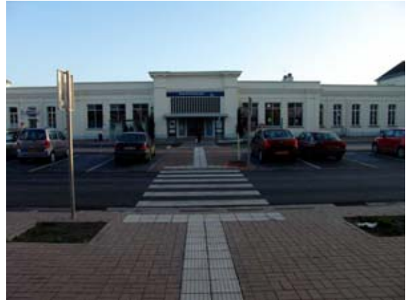
Entrepôt et place de la Gare