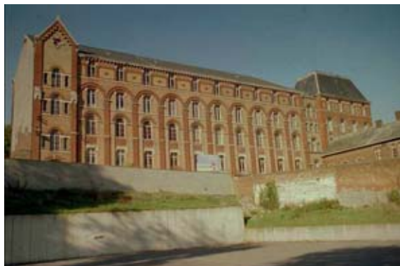
Les Arts et Métiers