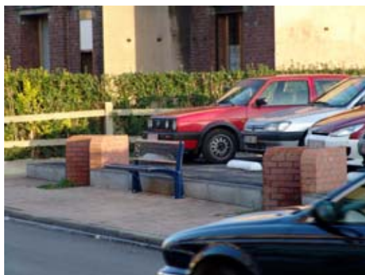
rue Albert I er , parking