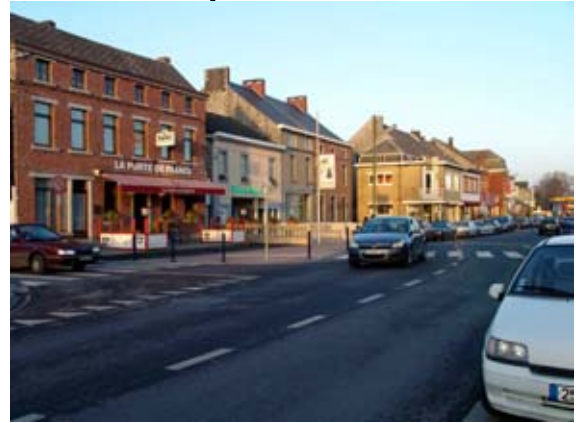
Commerces rue Albert 1 er