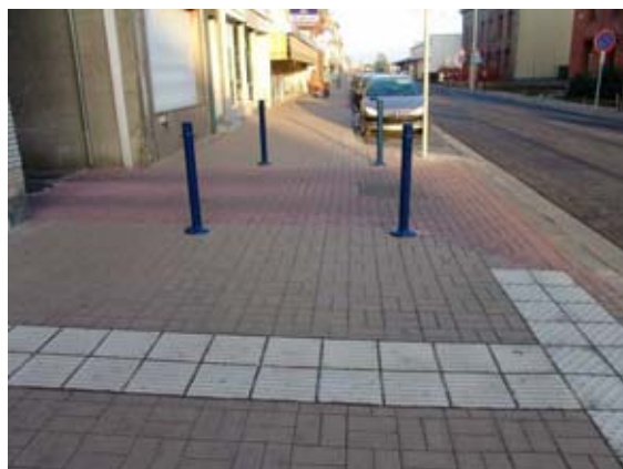
Trottoirs : accès personnes à mobilité réduite, marquage malvoyant, changement de couleur de revêtement pour les accès carrossables.