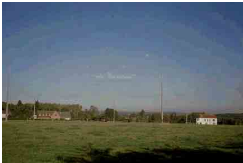
10. Rue du Fond depuis la rue des Sarts.

Biercée présente la particularité d'offrir de nombreuses vues paysagères intéressantes aux différentes marges du village, certaines vers les vallées, d'autres vers le centre de Thuin, d'autres encore vers les zones boisées. Ces paysages forment des respirations qu'il faut veiller à protéger lors de la construction éventuelle de nouveaux lotissements.