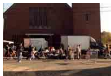
Foire aux pommes. (Photo S. Snyders).