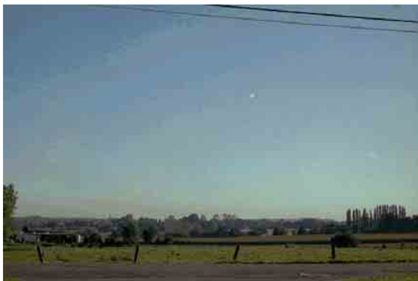
11. Vue vers Thuin et son beffroi depuis le carrefour des rues Catoire et Grignard.