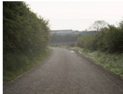
Bocage à Berlaimont, vue sur un bâtiment industriel.