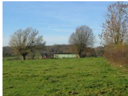
Prairie permanente et arbres têtards