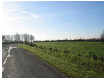
Entre la Longueville et Hargnies RD 117