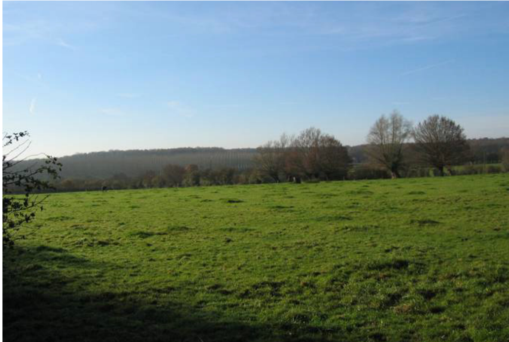
Horizon boisé de la forêt domaniale de Mormal, secteur de la Grande Carrière à Berlaimont.