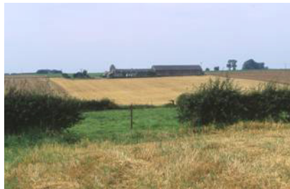
Ondulation du plateau Ferme de Forest.