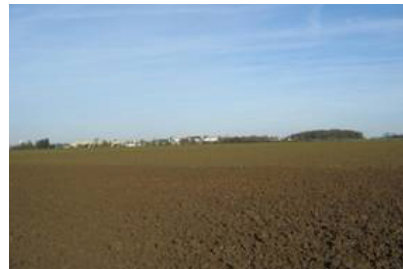
Silhouette urbaine d'Hautmont et du Fort.