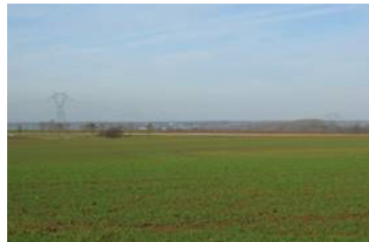
vu du plateau vers l'ouest avec, au-delà de la vallée de la Sambre, l'horizon boisé (Mormal).