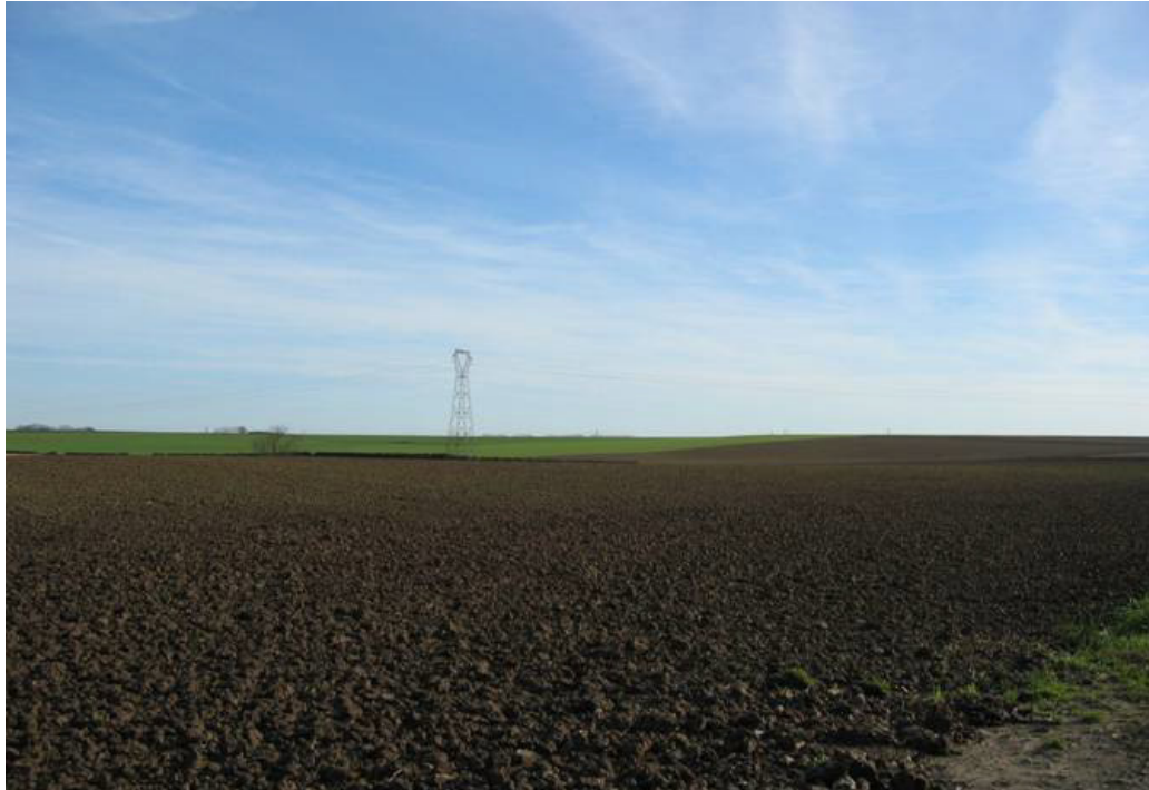
Paysages de champs ouverts entre Fontaine et Hautmont.