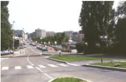
Le Mail de Sambre à Maubeuge.