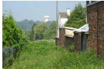
Vue vers le bois du Tilleul à Maubeuge (Sous-le-Bois), depuis l'autre rive de la Sambre.