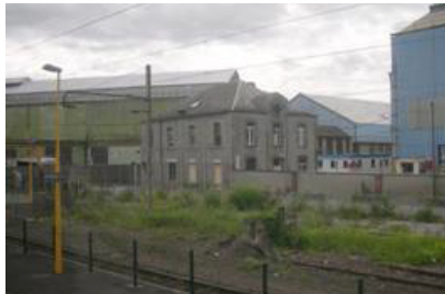
Louvroil, secteur industriel entre la Sambre et la voie ferrée.