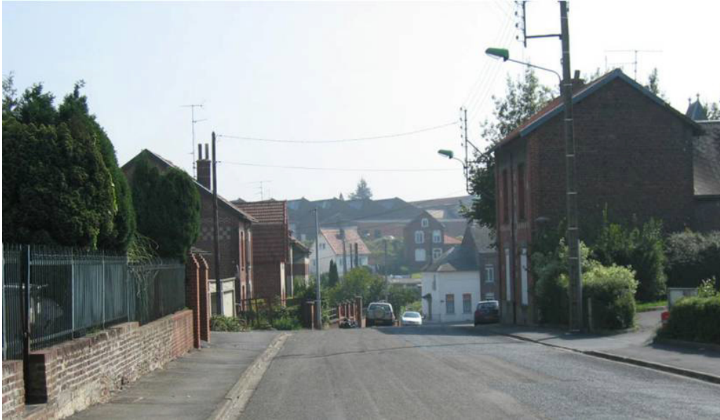
Etalement urbain sur les modulations du relief (Louvroil).