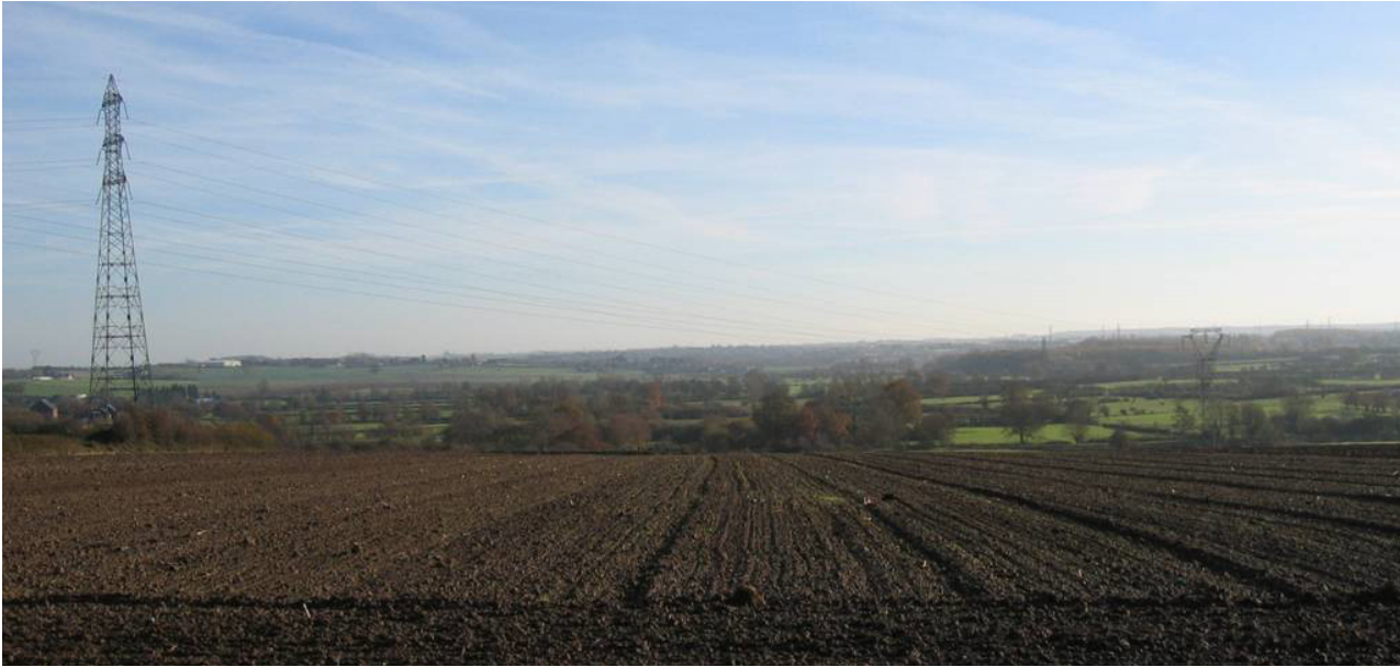
Vallée de la Sambre découverte depuis la RD 117 entre Vieux-Mesnil et Pont-sur-Sambre.