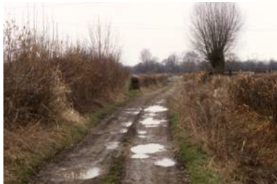
Ambiance bocagère à l'intérieur du méandre de Quartes (Pont-sur-Sambre).