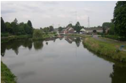
Ecluse de Berlaimont et bâtiments d'activités sur la Sambre entre Aulnoye-Aymeries et Berlaimont.