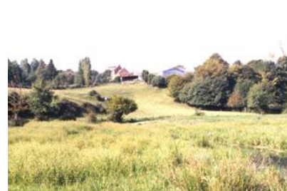
Versant abrupt de la Sambre à Boussières-sur-Sambre à proximité du ruisseau des Cligneux.