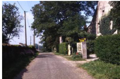
Ambiance entre Eclaibes et Limon.