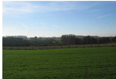
Vallée de la Tarsy entre Leval et Monceau.