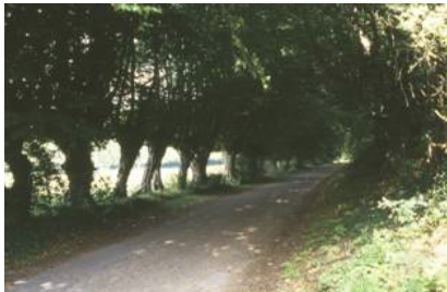
Alignement de Charmes têtards à proximité de la ferme du Château à Eclaibes.