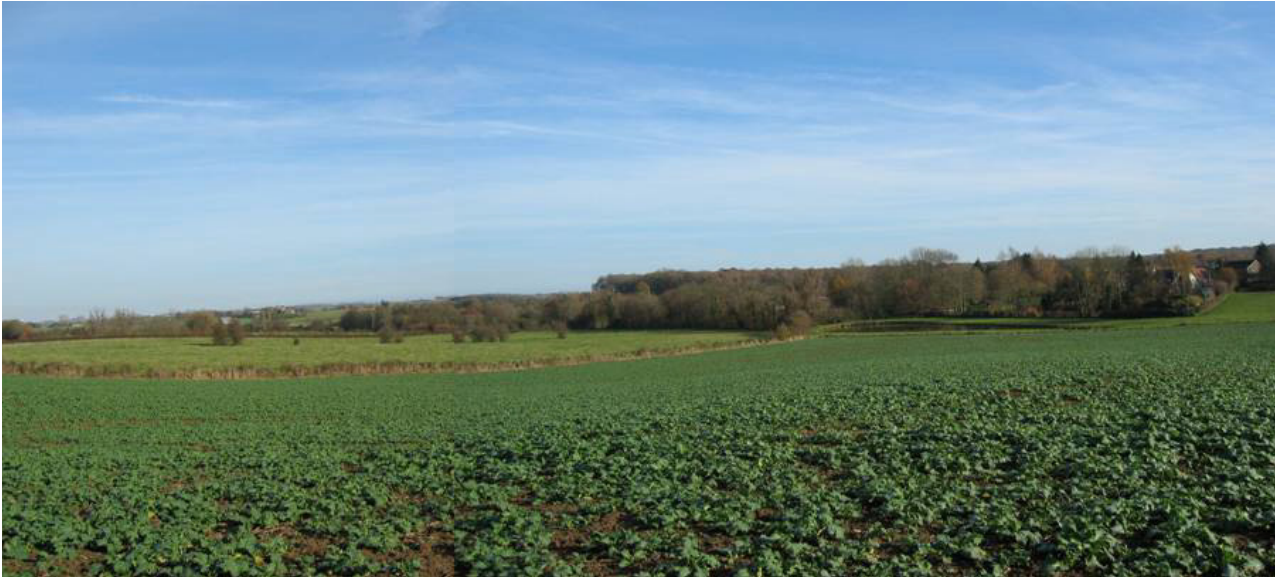
Contact entre le « plateau de la Sambre » et l'ambiance plantée de la Haie d'Avesnes.