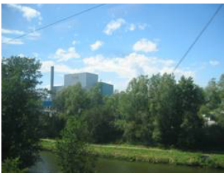
Industrie dans le fond de la vallée de la Sambre.