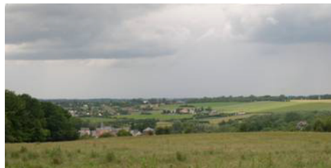
Village de Rocq et Vallon du ruisseau de la Chapelle, étirement bâti sur le versant de la rive droite de la Sambre.