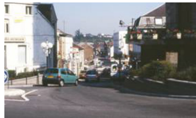
A Jeumont, rue Jean Jaurès, descente vers la Sambre. Vue sur l'autre versant