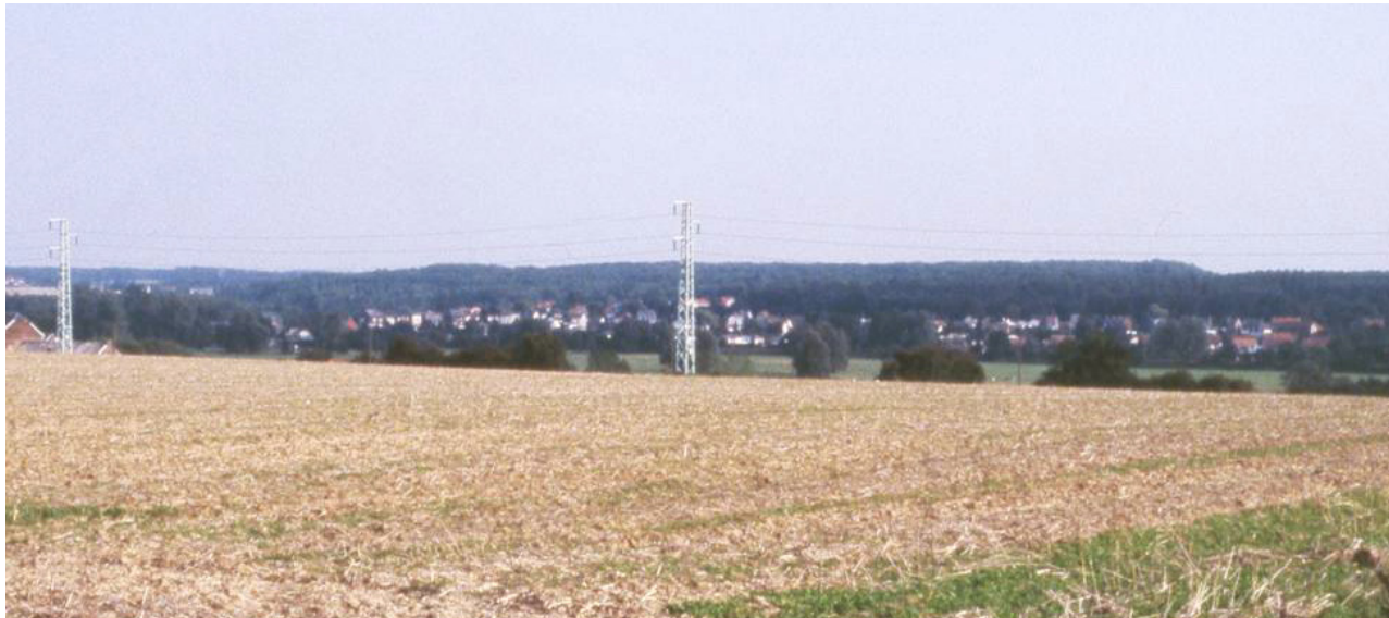
Horizon boisé au sud de la Sambre, vu depuis le sommet du versant de la rive gauche.