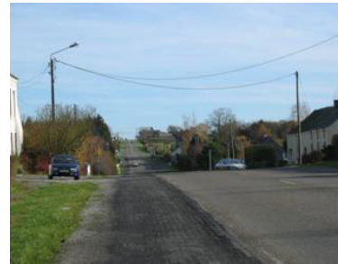
Ondulation du plateau sur la RD 936 à Colleret (le Pavé).