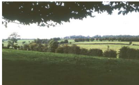
La vallée bocagère du Quiévelon depuis la redoute de Ferrière-la-Petite.