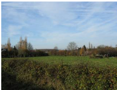
Le clocher de Colleret dans une ambiance bocagère depuis la RD 936.