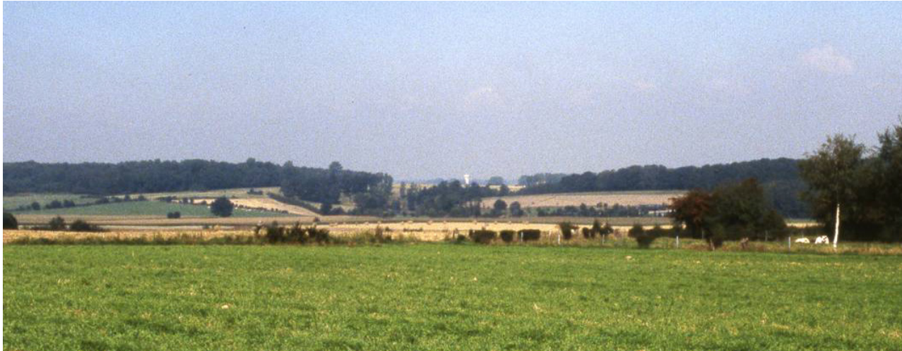
L'horizon boisé au nord, vu depuis le chemin du Fache à Colleret.