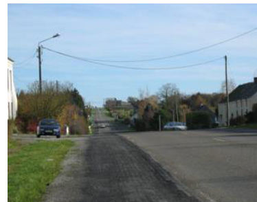
Ondulation du plateau sur la RD 936 à Colleret (le Pavé).