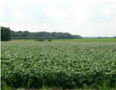
Bois de Pincemaille depuis le nord

Dans la partie est de l'unité, les villages proches des agglomérations de la région du Centre, se sont étendus le long des voies de communication (Buvrines). Entre ces villages, des hameaux et des fermes complètent la trame d'habitat. Le parcellaire agricole y est plus morcelé que dans la partie ouest et les prairies occupent une superficie plus importante.