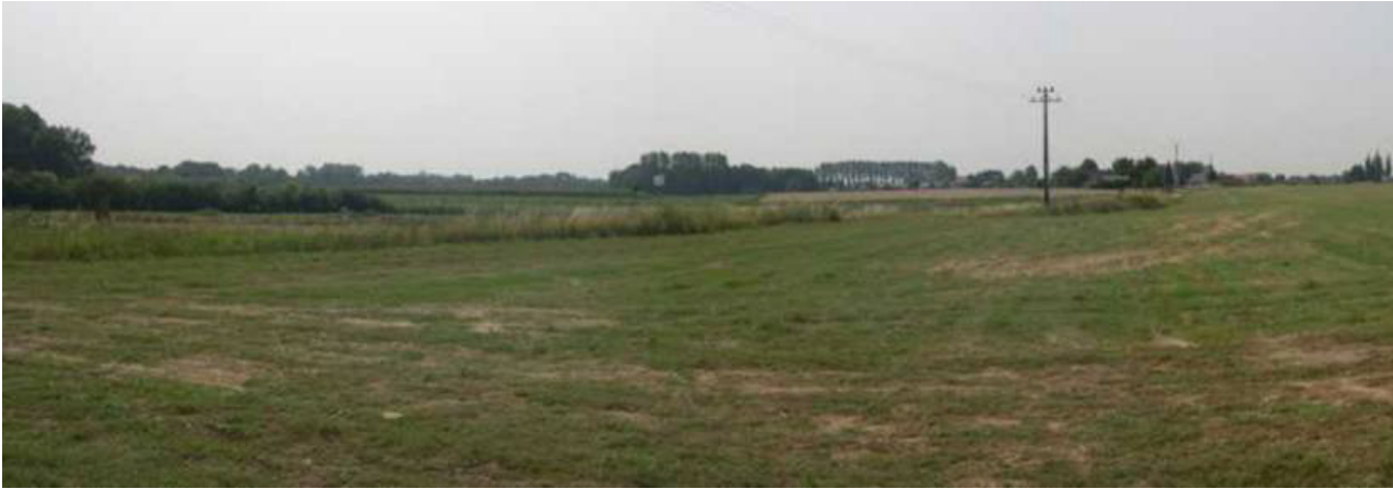
Vue depuis le relais RTBF de Mont-Sainte-Geneviève