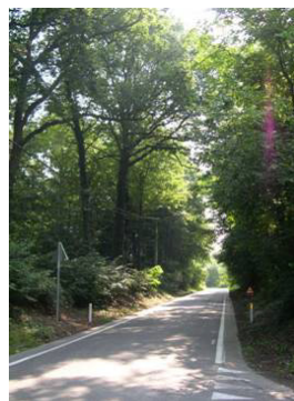
Traversée du Bois de Pincemaille