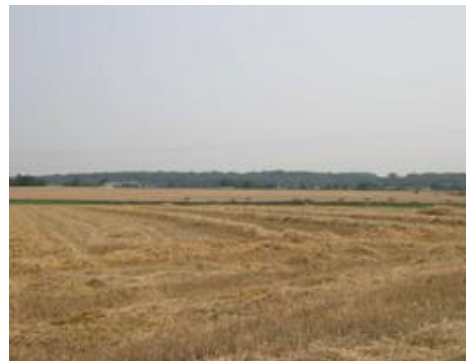
Horizon boisé situé à l'interfluve de la Sambre et de la Haine