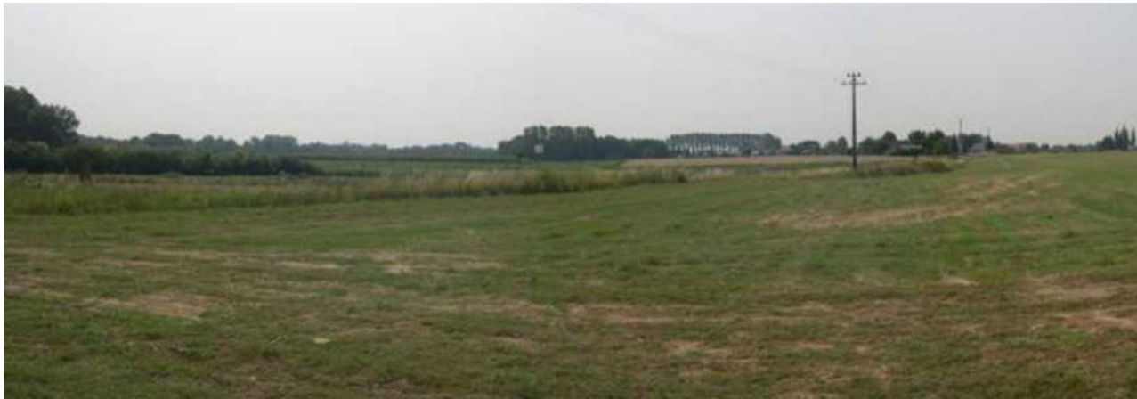
Vue depuis le relais RTBF de Mont-Sainte-Geneviève