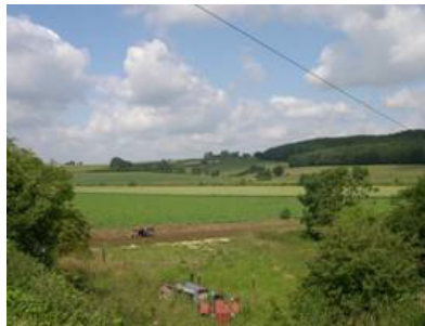
Versant agricole de la Sambre