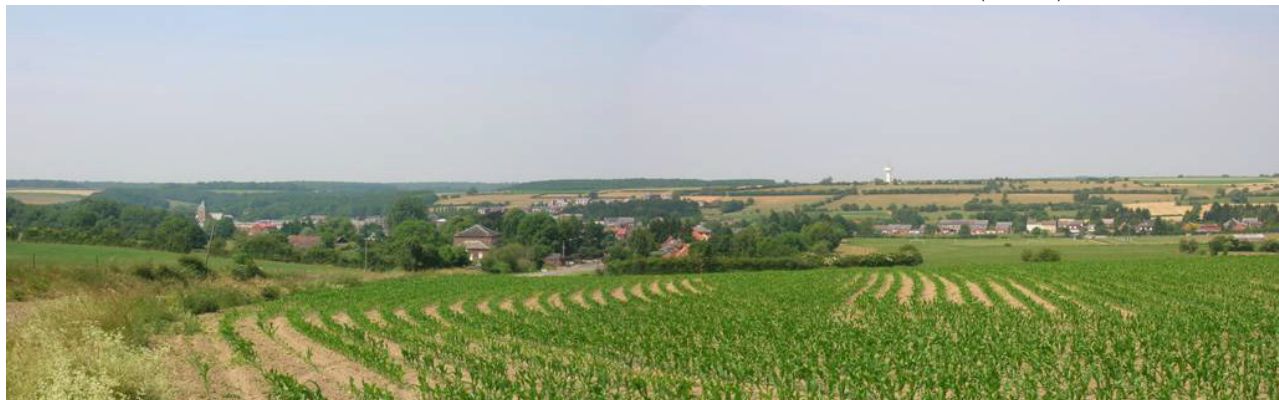
La dépression de la vallée de la Thure au niveau de Cousolre.