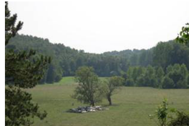
Vallée encaissée à Montignies Saint-Christophe.