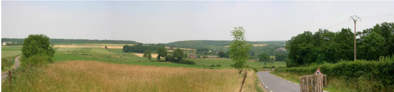
La dépression de la vallée de la Hantes au niveau de Bousignies-sur-Roc.