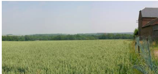
Le plateau au niveau de Hurtebise coupé par les boisements limitant la vallée de la Hantes.