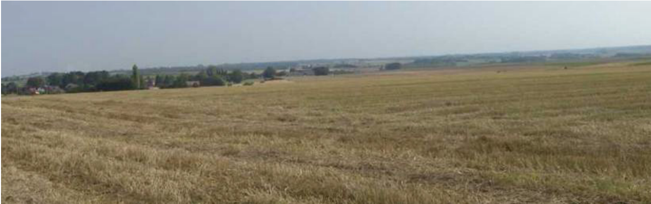
Le village de Ragnies (depuis Les Quatre Chemins)