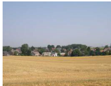
Le hameau d'Ossogne