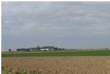
La ferme de Dansonspène