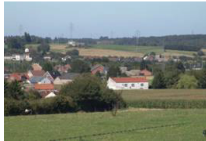
Limite du Bois de Goutroux