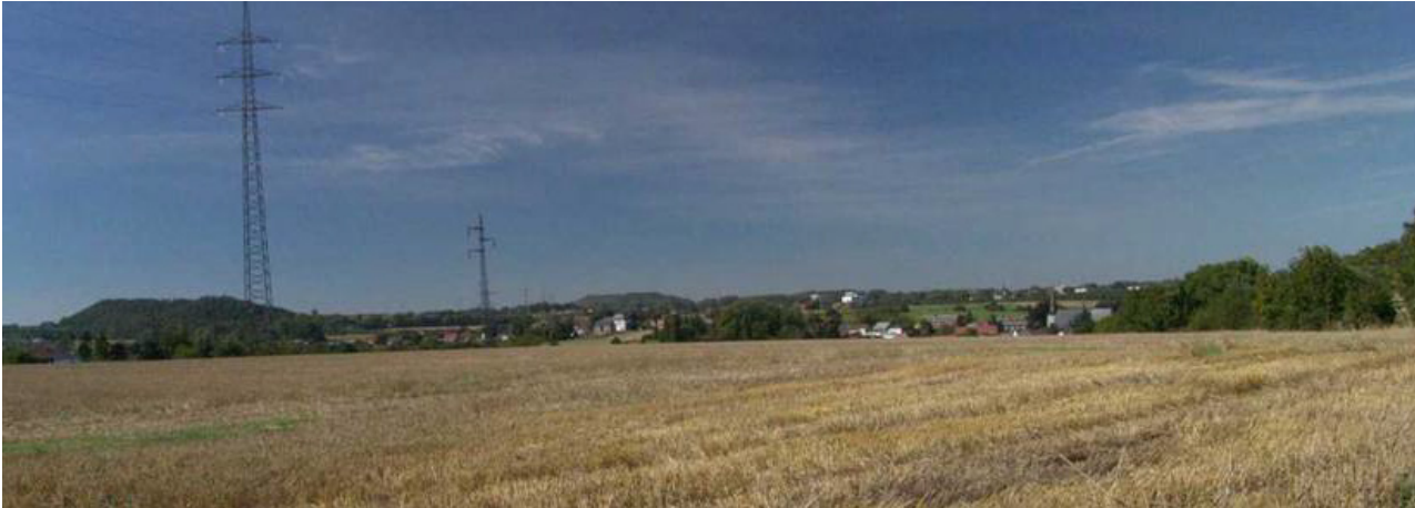
Le village de Leernes, entre paysages agricoles et terrils