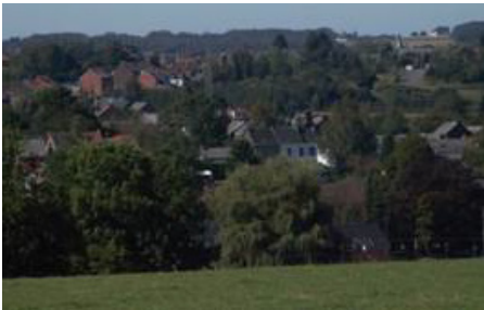
Fontaine-l'Évêque et, au loin, la ferme-château de la Marche