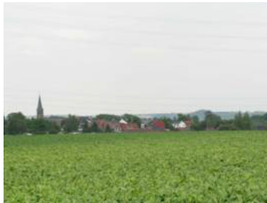
Forchies la Marche