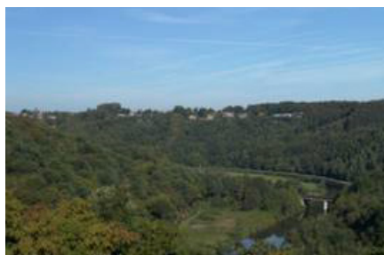
Vue depuis le quartier du Berceau à Thuin