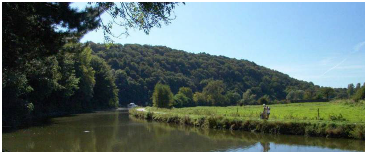
Le RAVeL, le long de la Sambre en aval de Thuin