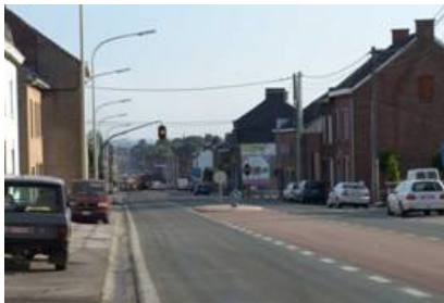
La route de Montigny-le-Tilleul vers Marchienne

Si les activités industrielles ont accompagné le passage de la voie ferrée en fond de vallée, de nombreuses extensions résidentielles et commerciales ont ensuite été effectuées, soit au sein des premiers noyaux ruraux, soit le long des différents axes routiers.