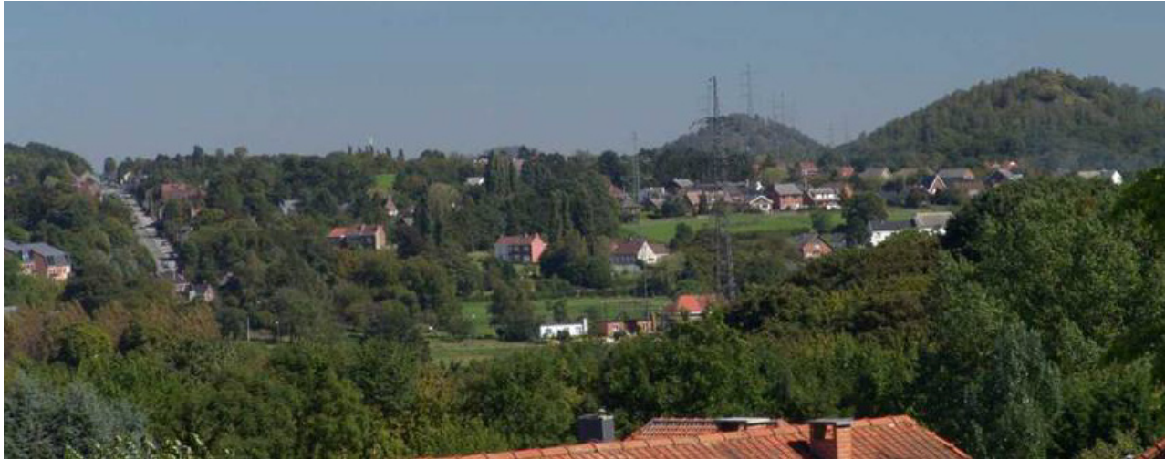
Vue sur la vallée de l'Eau d'Heure depuis le «M» de Bomerée