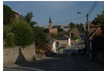
Le centre de Montigny-le-Tilleul