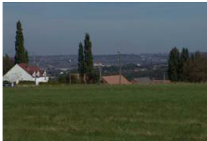
Vue sur la vallée industrialisée de la Sambre