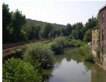
Ligne Charleroi – Walcourt, le long de l'Eau d'Heure