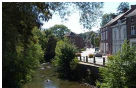
L'Eau d'Heure à Ham-sur-Heure