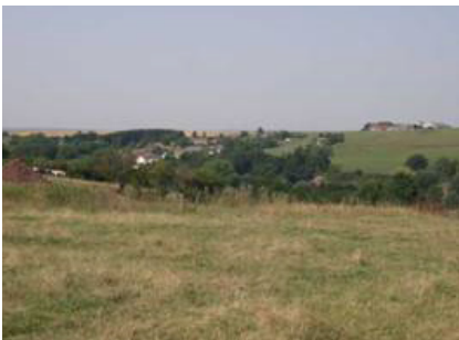
Cour-sur-Heure et le plateau de la Thudinie