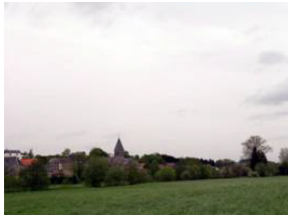
Fond de vallée arboré à Cour-sur-Heure