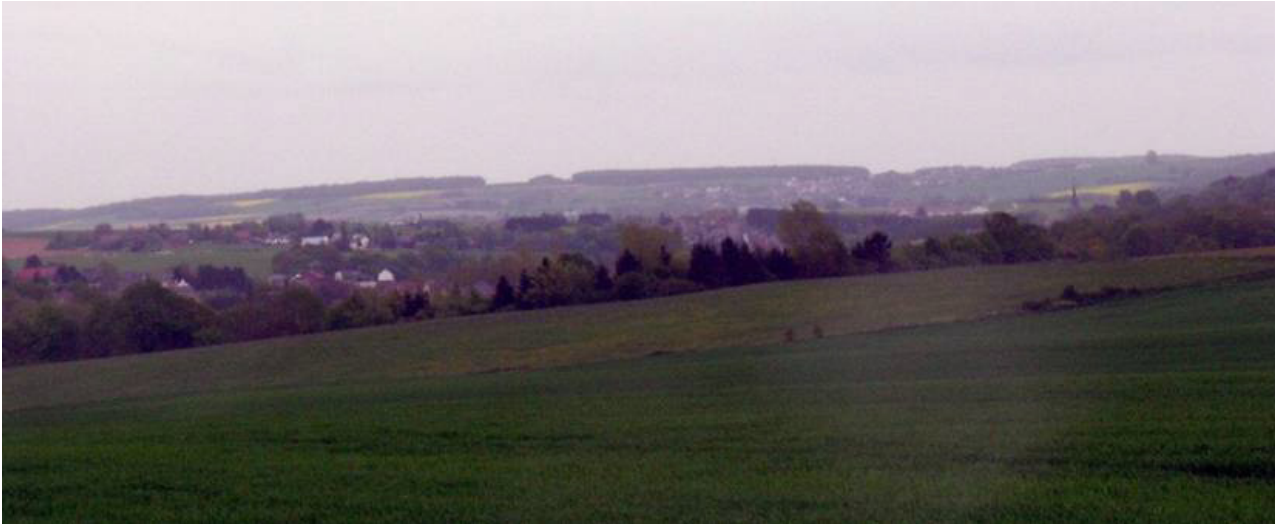
Bombement de la vallée du Thyria et horizon boisé de la Fagne