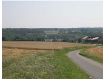
Carrière dans la vallée de l'Eau d'Heure